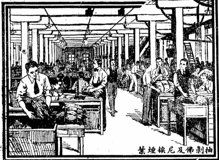
葉煙挨尼及佛剝抽